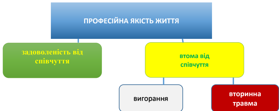
РИСУНОК 1: ДІАГРАМА ПРОФЕСІЙНОЇ ЯКОСТІ ЖИТТЯ

Позитивний аспект — це задоволеність від співчуття (Compassion Satisfaction, CS), а негативний аспект — це втома від співчуття (Compassion Fatigue, CF). Втома від співчуття поділяється на дві частини. Перша частина стосується почуття виснаження, фрустрації, гніву ц депресії, властивих для вигорання (Burnout, BO). Вторинний травматичний стрес (Secondary Traumatic Stress, STS) — негативні переживання, спричинені страхом і травматичними подіями, пов'язаними з роботою. Деякі з них можуть бути прямими (первинними) травмами. В інших випадках травма, пов'язана з роботою, є комбінацією як первинної, так і вторинної травми.