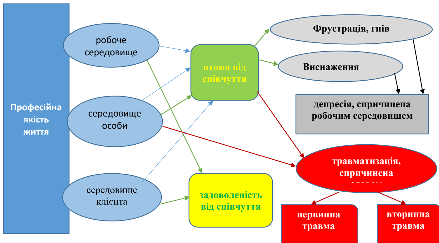
РИСУНОК 2: АНАЛІЗ ТЕОРЕТИЧНИХ ШЛЯХІВ

Загальна концепція професійної якості життя є складною, оскільки вона пов'язана з характеристиками робочого середовища (організаційними й робочими), особистісними характеристиками індивіда і впливу на нього первинної та вторинної травми під час роботи. Ця складність стосується оплачуваних працівників (наприклад, медичного персоналу) і волонтерів (наприклад, рятувальників Червоного Хреста).